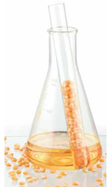
Biodiesel lässt sich aus vielen Kulturpflanzen erzeugen – hier aus Mais.

die die Pflanzen vorher durch Photosynthese der Umgebung entnommen haben, sie sind also CO 2 -neutral. Das Erneuerbare Energien Gesetz (EEG) soll die Erzeugung von Treibhausgasen – zum Beispiel CO 2 – und die Abhängigkeit von fossilen Energieträgern wie Erdöl, Erdgas und Kohle und von deren Import verringern. Weiterhin gibt es vom Bund, der Kreditanstalt für Wiederaufbau (KfW) und den Ländern attraktive Förderprogramme für Immobilienbesitzer, die jetzt auf erneuerbare Energien umrüsten. Und zum finanziellen Nutzen kommt das gute Gefühl, etwas gegen den Klimawandel getan zu haben.