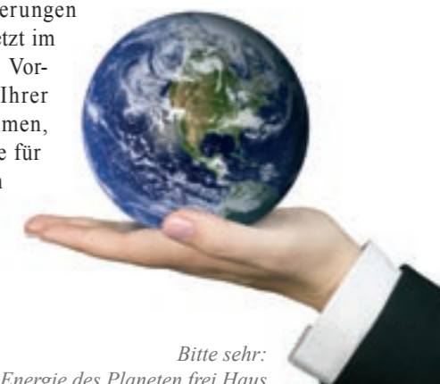
Bitte sehr: die Energie des Planeten frei Haus

Kontakt & Infos: CO 2 SPARHAUS Tel. (0 40) 52 73 47 80 www.co2sparhaus.de