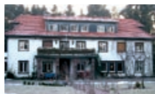
Das Resultat nach Bauabschluss: 70% Energie-Einsparung nach der Sanierung von Fassade, Dach, Fenstern, Heizung!

Der Staat fördert in hohem Maße das Umstellen auf energiesparende und ökologisch sinnvolle Wärme-Dämm-Maßnahmen! Wir sind Ihr neutraler Berater für gewerkeübergreifende Planung und helfen, alle behördlichen Mittel optimal auszuschöpfen.